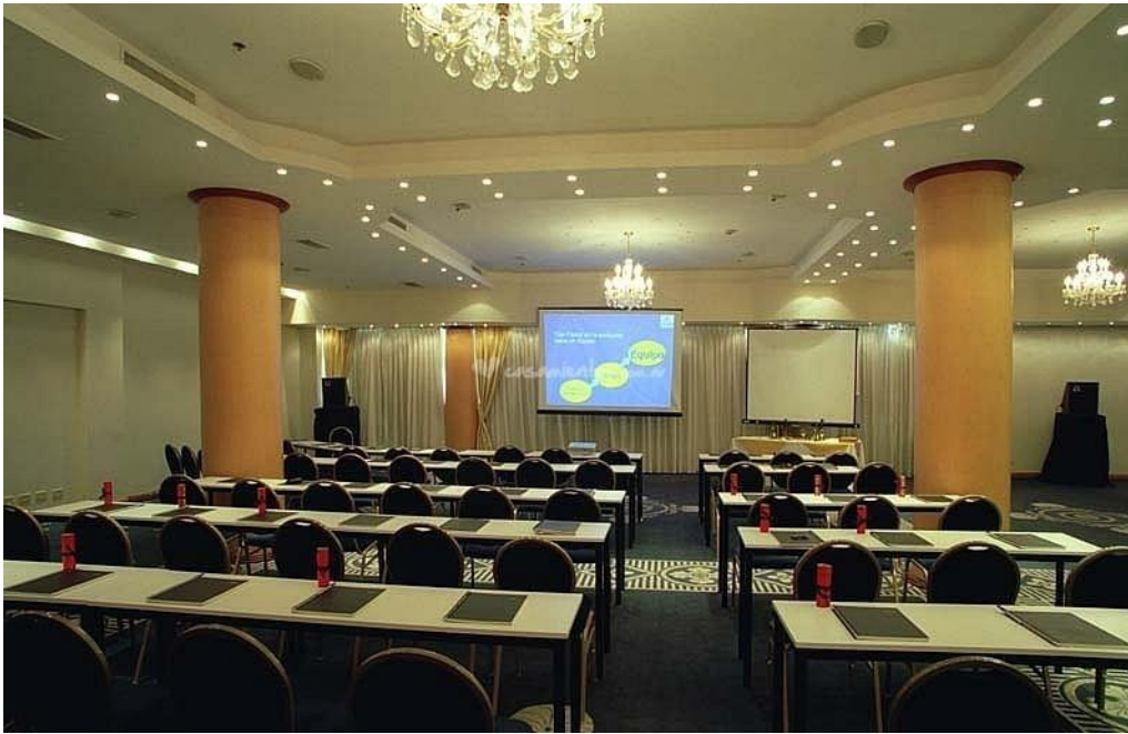
SALÓN BELGRANO- AUDITORIO