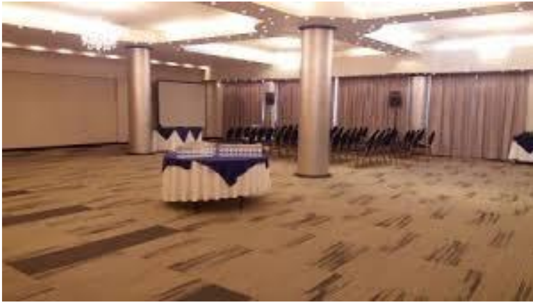
SALON PARA CAFETERIA Y SPONSOR